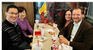
エリス牧師ご夫妻と