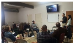
スタッフ会の様子

スタッフ会でもビジョンを分かち合いました。「あなたたちは主の御前に靴を脱いで謙遜に。自分たちのベストではなく、主のベストをいつも選びなさい。」と、あるスタッフがアドバイスを下さいました。出会いはまさに主からの賜物です。