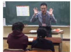
「聞」の漢字の成り立ちを熱弁中！